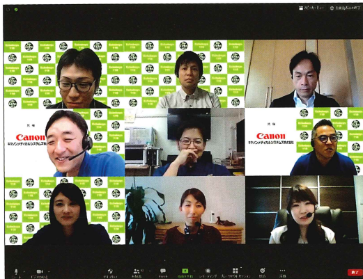
図1 The Echo WEB Special Seminar (夏フェス Sonographers' Day) における配信風景